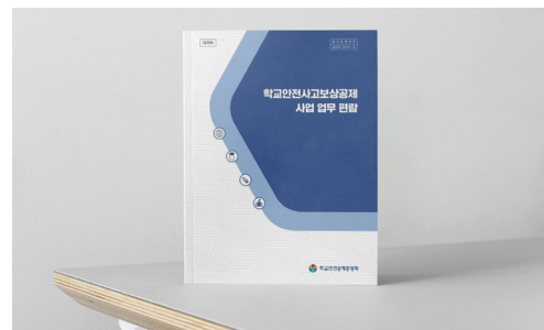
학교안전사고보상공제 사업 업무 편람 ▶

학교안전사고에 대한 신속·적정한 보상실현 및 통일적 업무 처리를 위해 업무 편람을 제작하여 보급하고 학교안전 관련 법령 개정 사항, 최신 판례 등 공제제도 운영 관련 사항을 최신화하여 제공합니다.