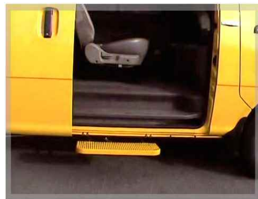
15. 승강구 설치유무